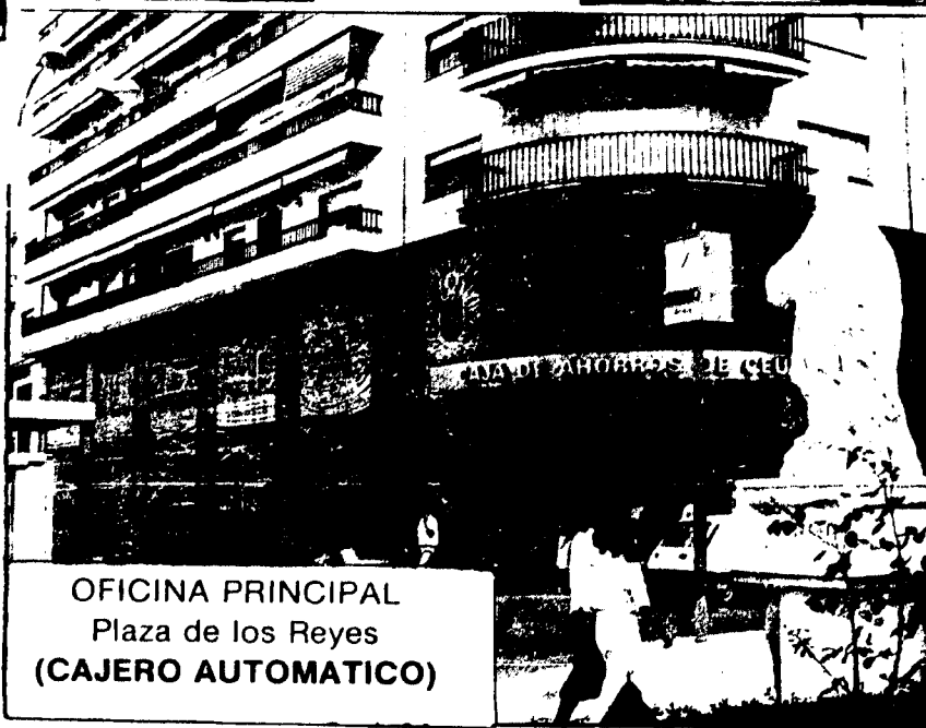
OFICINA PRINCIPAL Plaza de los Reyes (CAJERO AUTOMATICO)