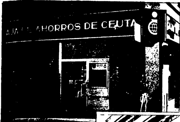
URBANA NUM. UNO Plaza de la Constitucion (CAJERO AUTOMATICO)