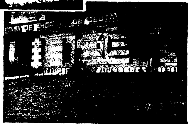
URBANA NUM. CUATRO Poligono Virgen de Africa