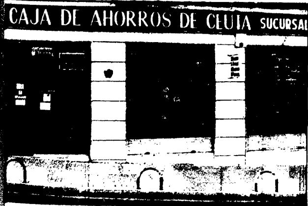
URBANA NUM. TRES Barriada de Villa-Jovita