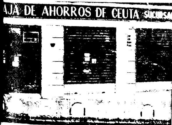
URBANA NUM TRES Barriada de Villa-Jovita