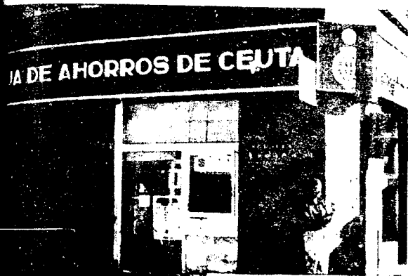
URBANA NUM UNO Plaza de la Constitucion (CAJERO AUTOMATICO)