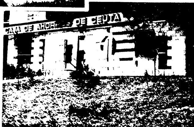
URBANA NUM CUATRO Poligono Virgen de Africa