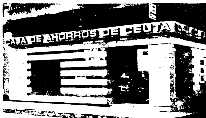
URBANA NUM DOS Barriada de San Jose (CAJERO AUTOMATICO)