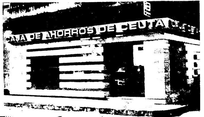
URBANA NUM DOS Barriada de San Jose (CAJERO AUTOMATICO)