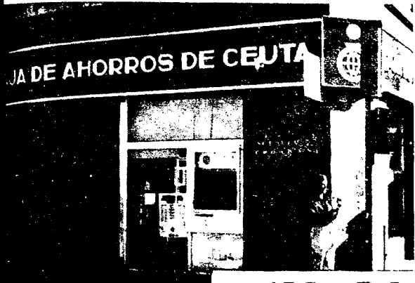
URBANA NUM UNO Plaza de la Constitucion (CAJERO AUTOMATICO)