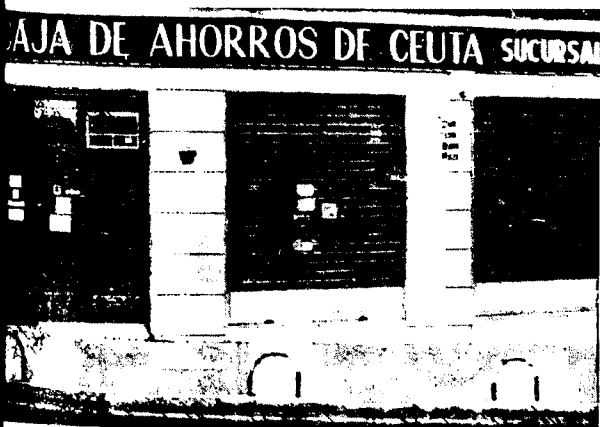
URBANA NUM TRES Barriada de Villa-Jovita