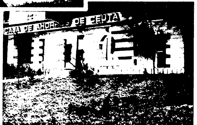
URBANA NUM CUATRO Poligono Virgen de Africa