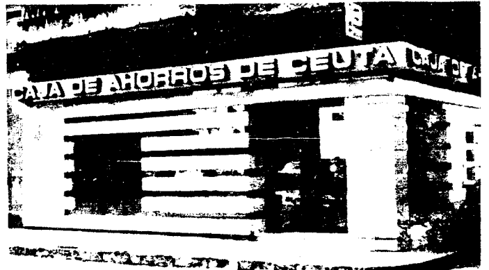
URBANA NUM DOS Barriada de San Jose (CAJERO AUTOMATICO)