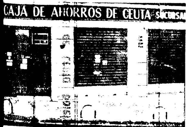
URBANA NUM TRES Barriada de Villa-Jovita