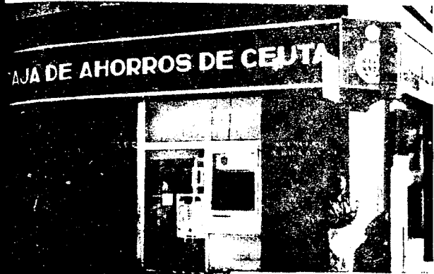
URBANA NUM UNO Plaza de la Constitucion (CAJERO AUTOMATICO)