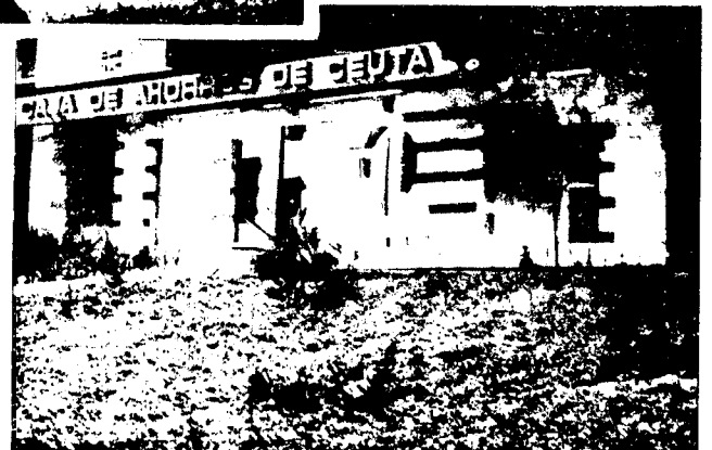
URBANA NUM CUATRO Poligono Virgen de Africa