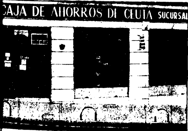
URBANA NUM. TRES Barriada de Villa-Jovita