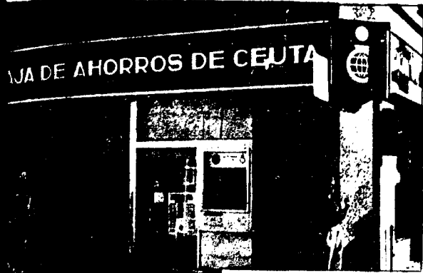
URBANA NUM. UNO Plaza de la Constitucion (CAJERO AUTOMATICO)