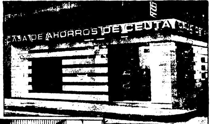
URBANA NUM. DOS Barriada de San José (CAJERO AUTOMATICO)