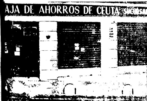
URBANA NUM TRES Barriada de Villa-Jovita