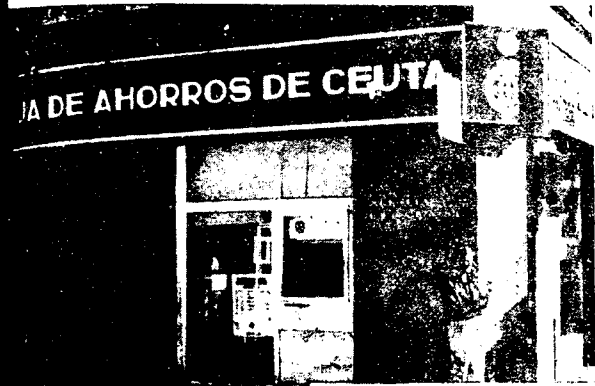
URBANA NUM UNO Plaza de la Constitucion (CAJERO AUTOMATICO)