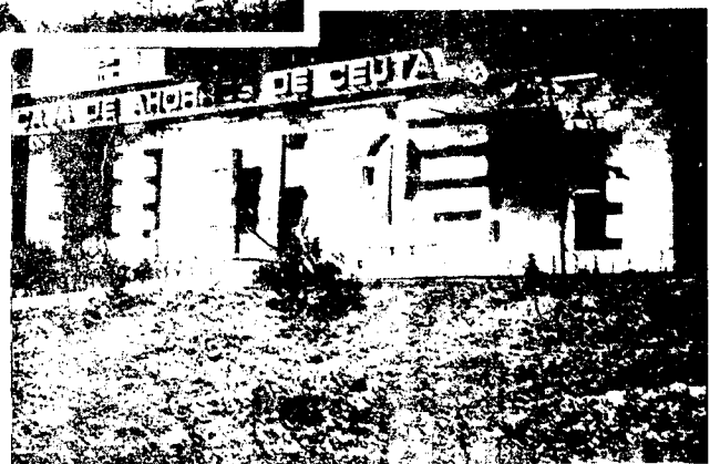
URBANA NUM CUATRO Poligono Virgen de Africa