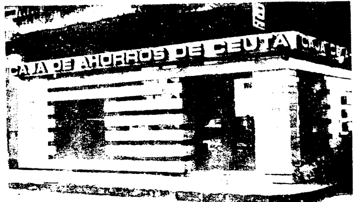
URBANA NUM DOS Barriada de San Jose (CAJERO AUTOMATICO)