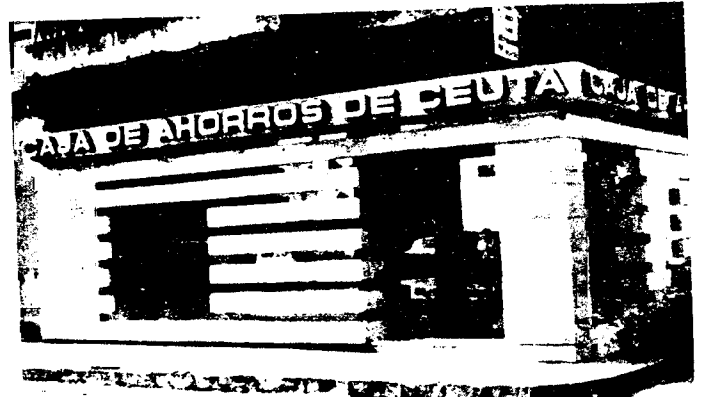
URBANA NUM DOS Barriada de San Jose (CAJERO AUTOMATICO)