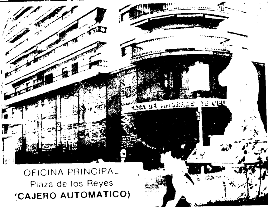
OFICINA PRINCIPAL Plaza de los Reyes (CAJERO AUTOMATICO)