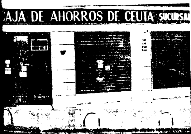
URBANA NUM TRES Barriada de Villa-Jovita