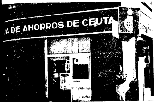
URBANA NUM UNO Plaza de la Constitucion (CAJERO AUTOMATICO)