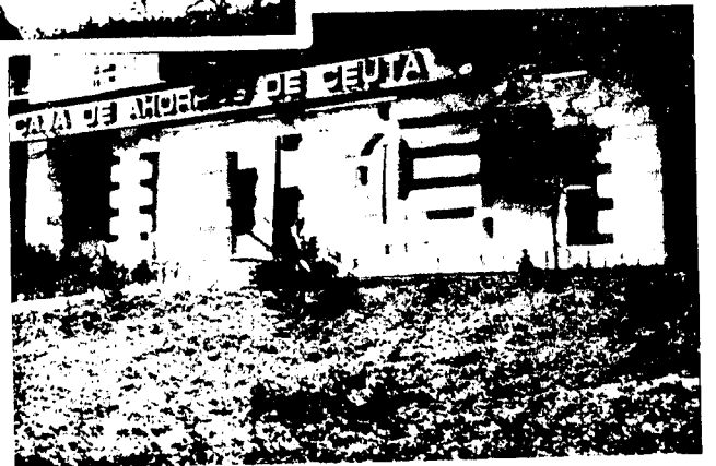
URBANA NUM CUATRO Poligono Virgen de Africa