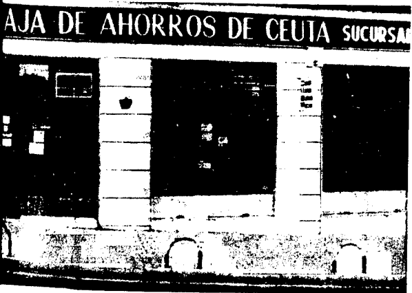
URBANA NUM TRES Barriada de Villa-Jovita