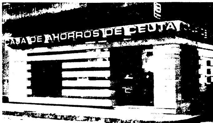
URBANA NUM DOS Barriada de San Jose (CAJERO AUTOMATICO)