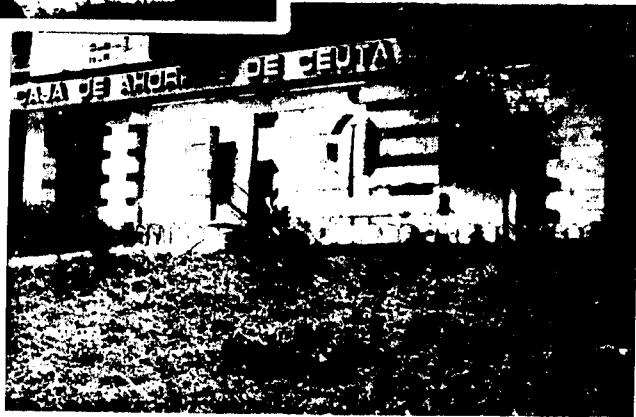
URBANA NUM CUATRO Poligono Virgen de Africa