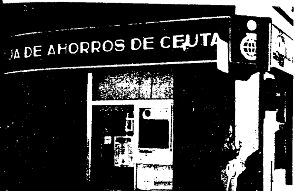
URBANA NUM UNO Plaza de la Constitución (CAJERO AUTOMATICO)