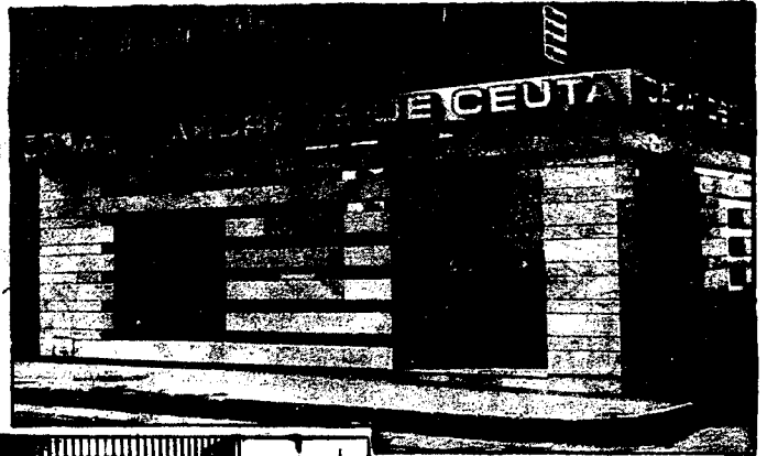
URBANA NUM. DOS Barriada de San José (CAJERO AUTOMATICO)