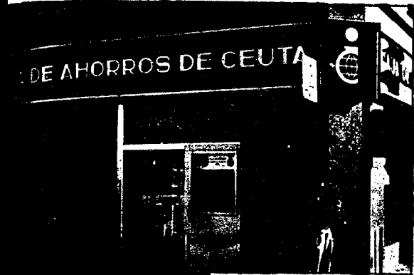
URBANA NUM. UNO Plaza de la Constitución (CAJERO AUTOMATICO)