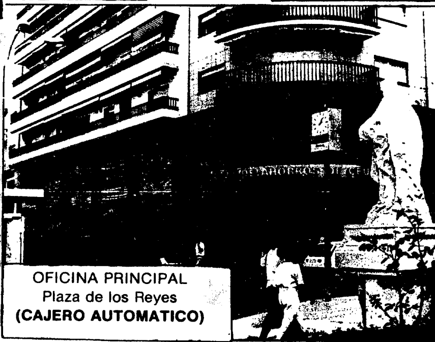
OFICINA PRINCIPAL Plaza de los Reyes (CAJERO AUTOMATICO)