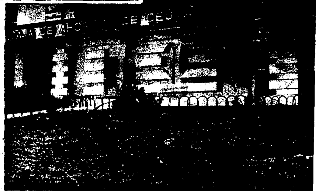
URBANA NUM. CUATRO Poligono Virgen de Africa