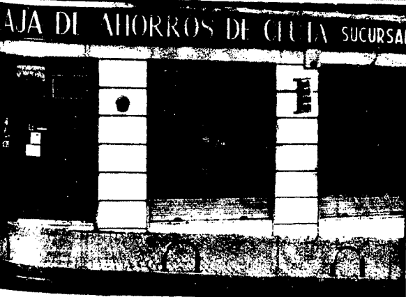
URBANA NUM. TRES Barriada de Villa-Jovita