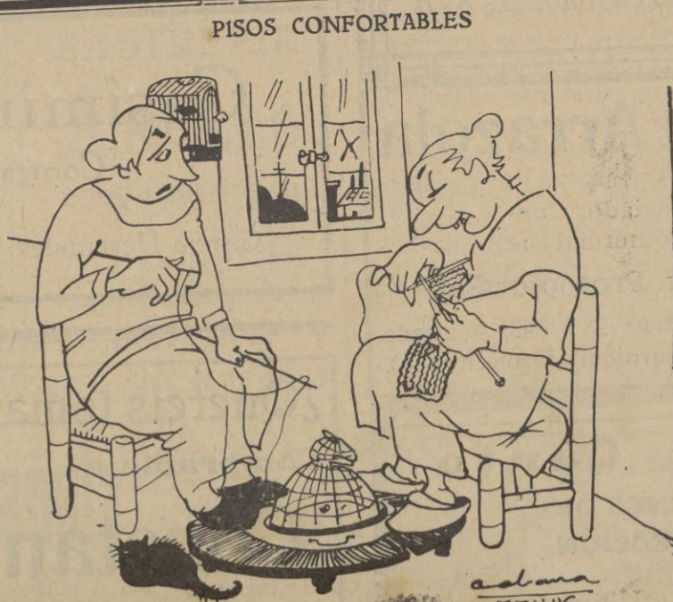
Un ático con calefacción central.

Número premiado en la Cruz Roja correspondiente al día de ayer