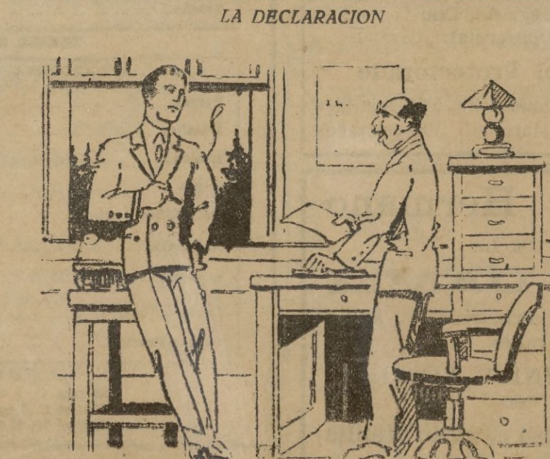
—Dos años que vengo paseando a su hija y, trancamente, yo deseaba... —No creo que pretenda usted el regalo de un par de zapatos...

Mas del 70 por 100 de los automóviles que se construyen en América van equipados, con la BUJIA A. C. La BUJIA A. C. de fabricación americana se halla ahora de venta en todos los establecimientos del ramo.