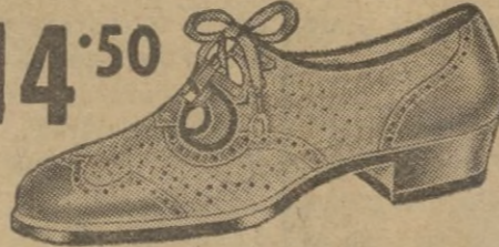
Bonito modelo en boxcalf.