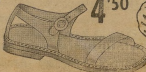
Muy cómodo y ligero.