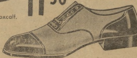
Bonito zapato de tela, con suela de goma.