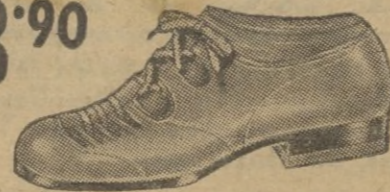
Fuerte zapato en boxcalf blanco.