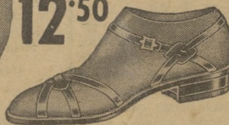
Ligero y airoso para la playa.