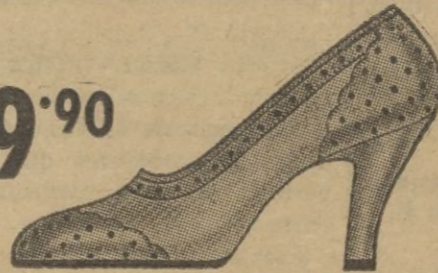
Zapato elegante combinado en tela.