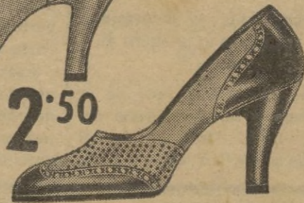
Gustoso modelo en tafilite combinado con charol.