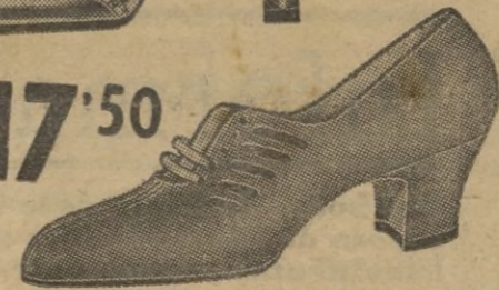
En ante- muy chic.