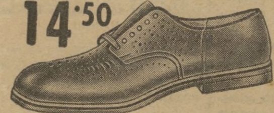
Cómodo y airoso zapato en boxcalf marrón.