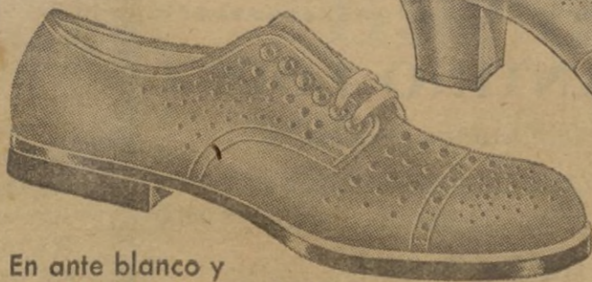
En ante blanco y marrón. Muy ligero. Suela de cuero.