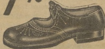
Zapato de niño, elegante en charol o tafilite.