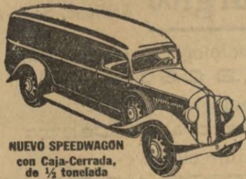
NUEVO SPEEDWAGON con Caja-Correda, de 1/2 tonelada