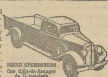
NUEVO SPEEDWAGON con Caja-Recogedor de 1/2 tonelada.

Estilo perfilado—fuerza para gran velocidad y gran tiro—hechos y equilibrados para extraordinaria duración—estos nuevos y magníficos Speedwagons representan, en todo y por todo, los modelos de MAYOR VALIA INTRINSECA que la Reo ha podido producir durante 30 años de experiencia en la fabricación de vehiculos de indiscutible superioridad. Los Speedwagons Reo se suministran en capacidades de media tonelada y hasta de 6 toneladas, incluyendo los tipos de Tractor-Remolque y de Omníbuses.