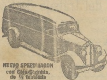
NUEVO SPEEDWAGON con Caja de Adidos de 1/2 tonelada.

Estilo perfilado—fuerza para gran velocidad y gran tiro—hechos y equilibrados para extraordinaria duración—estos nuevos y magníficos Speedwagons representan, en todo y por todo, los modelos de MAYOR VALIA INTRINSECA que la Reo ha podido producir durante 30 años de experiencia en la fabricación de vehiculos de indiscutible superioridad. Los Speedwagons Reo se suministran en capacidades de media tonelada y hasta de 6 toneladas, incluyendo los tipos de Tractor-Remolque y de Omníbuses.