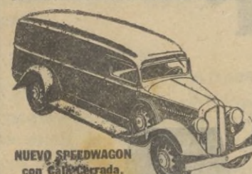
NUOVO SPEEDWAGON con Caja Central de 1/2 tonelada.