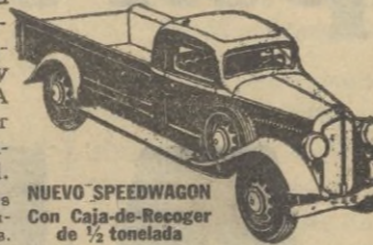
NUOVO SPEEDWAGON Con Caja de Remolque de 1/2 tonelada.

Estilo perfilado—fuerza para gran velocidad y gran tiro—hechos y equilibrados para extraordinaria duración—estos nuevos y magníficos Speedwagons representan, en todo y por todo, los modelos de MAYOR VALIA INTRINSECA que la Reo ha podido producir durante 30 años de experiencia en la fabricación de vehículos de indiscutible superioridad.