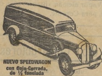
NUEVO SPEEDWAGON con Caja-Cerrada, de 1/2 tonelada