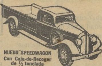
NUEVO SPEEDWAGON con Caja-de-Recoger de 1/2 tonelada

Estilo perfilado—fuerza para gran velocidad y gran tiro—hechos y equilibrados para extraordinaria duración—estos nuevos y magníficos Speedwagons representan, en todo y por todo, los modelos de MAYOR VALIA INTRINSECA que la Reo ha podido producir durante 30 años de experiencia en la fabricación de vehículos de indiscutible superioridad. Los Speedwagons Reo se suministran en capacidades de media tonelada y hasta de 4 a 6 toneladas, incluyendo los tipos de Tractor-Remolque y de Ombibus.