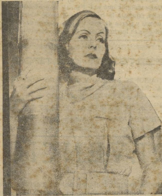
La exquisita mujer fatal por excelencia que acaba de sufrir un accidente al caerse del mástil de un «yatch», produciéndose la fractura de una pierna.