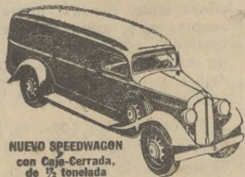
NUEVO SPEEDWAGON con Caja-Cerrada, de 1/2 tonelada