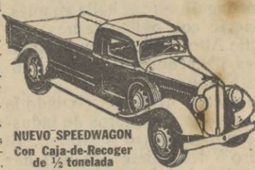
NUEVO SPEEDWAGON con Caja-de-Recoger de 1/2 tonelada

Estilo perfilado—fuerza para gran velocidad y gran tiro—hechos y equilibrados para extraordinaria duración—estos nuevos y magníficos Speedwagons representan, en todo y por todo, los modelos de MAYOR VALIA INTRINSECA que la Reo ha podido producir durante 30 años de experiencia en la fabricación de vehículos de indiscutible superioridad.