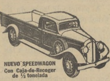
NUEVO SPEEDWAGON con Caja-de-Recoger de 1/2 tonelada

Estilo perfilado—fuerza para gran velocidad y gran tiro—hechos y equilibrados para extraordinaria duración—estos nuevos y magníficos Speedwagons representan, en todo y por todo, los modelos de MAYOR VALÍA INTRÍNSECA que la Reo ha podido producir durante 30 años de experiencia en la fabricación de vehículos de indiscutible superioridad. Los Speedwagons Reo suministran en capacidades de media tonelada y hasta de 4 a 6 toneladas, incluyendo los tipos de Tractor-Remolque y de Omnibus.