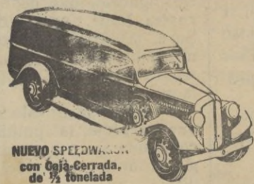
NUEVO SPEEDWAGON con Caja Cerrada, de 1/2 tonelada