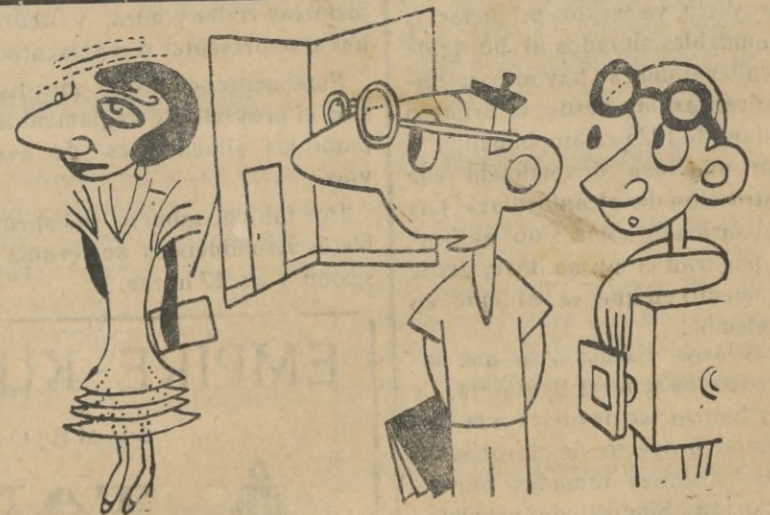
—Si. Ella es una imposición del comanditario. —Lo de todos los días. Una historia de amor que se abre al cabo del rodaje de un film alucinante.