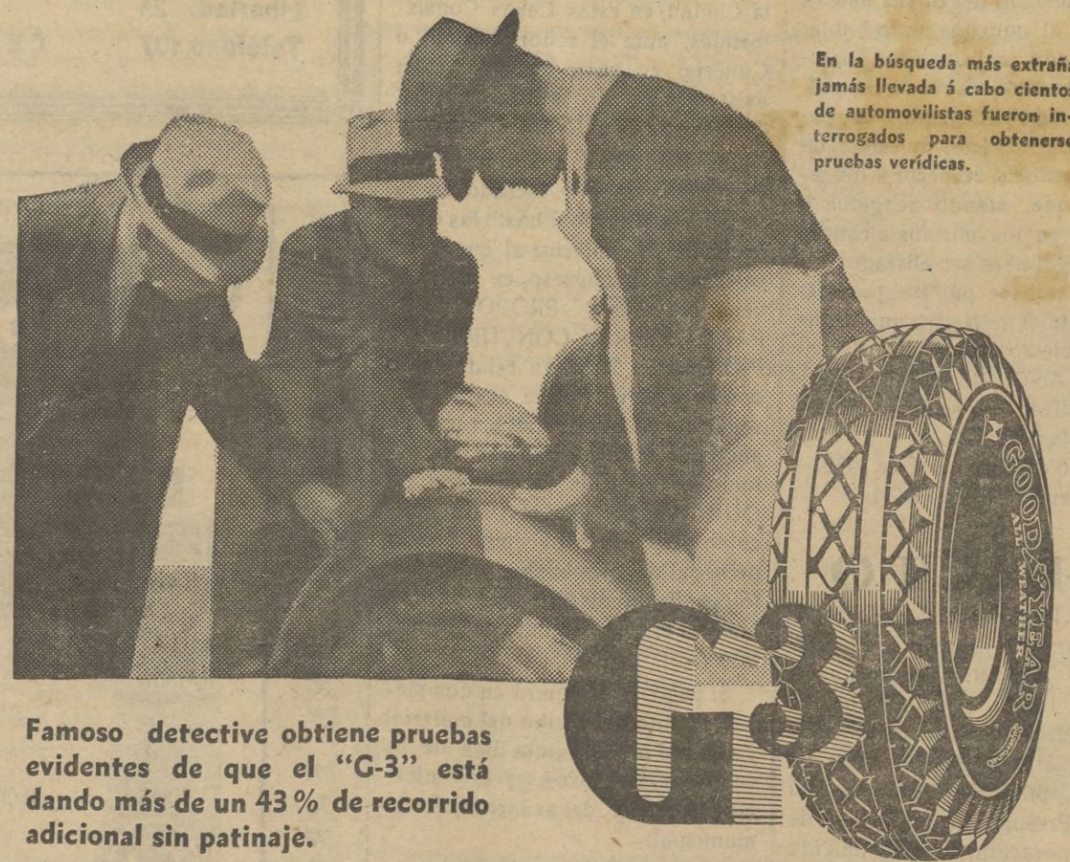
En la búsqueda más extraña jamás llevada a cabo cientos de automovilistas fueron interrogados para obtenerse pruebas verídicas.

Famoso detective obtiene pruebas evidentes de que el “G-3” está dando más de un 43% de recorrido adicional sin patinaje.