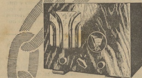
520 A Corriente alterna

La profunda experiencia de PHILIPS en la construcción de receptores, el prestigio de sus Laboratorios y sus poderosos medios de producción, han permitido a PHILIPS añadir a los componentes tangibles de cada receptor un algo invisible e impalpable, que escapa a toda expresión material. Este "Elemento invisible", simbolizado por el emblema de ondas y estrellas, da a los aparatos PHILIPS una plus-valía que es garantía de la máxima calidad.