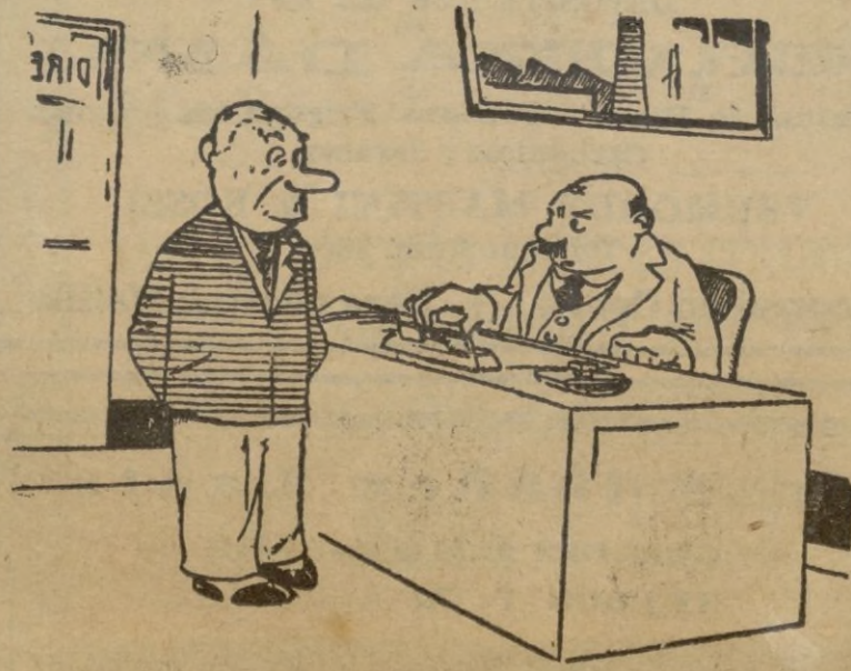
—¿Por qué no ha venido usted antes a recoger la cartilla de parado? —No puede usted imaginar. Me ha salido un trabajo atroz.