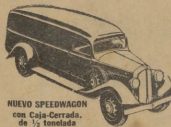
NUEVO SPEEDWAGON con Caja-Cerrada, de 1/2 tonelada