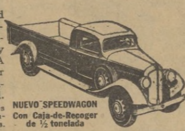
NUEVO SPEEDWAGON con Caja-de-Recoger, de 1/2 tonelada

¡CAMIONES DE MUCHA MÁS VALÍA POR POCO MÁS QUE LOS DEL PRECIO MÁS BAJO!