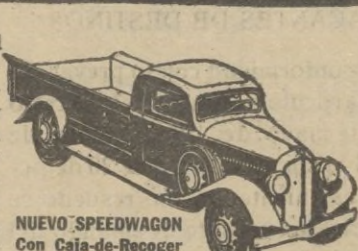
NUEVO SPEEDWAGON con Caja-de-Recoger de ½ tonelada

Estilo perfilado—fuerza para gran velocidad y gran tiro—hechos y equilibrados para extraordinaria duración—estos nuevos y magníficos Speedwagons representan, en todo y por todo, los modelos de MAYOR VALÍA INTRINSECA que la Reo ha podido producir durante 30 años de experiencia en la fabricación de vehículos de indiscutible superioridad. Los Speedwagons Reo se suministran en capacidades de media tonelada y hasta de 4 a 6 toneladas, incluyendo los tipos de Tractor-Remolque y de Omnibus.