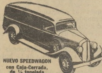
NUEVO SPEEDWAGON con Caja-Cerrada de ½ tonelada