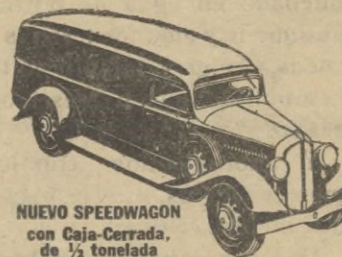
NUEVO SPEEDWAGON con Caja-Cerrada, de 1/2 tonelada