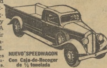
NUEVO SPEEDWAGON con Caja-de-Recoger, de 1/2 tonelada

Estilo perfilado—fuerza para gran velocidad y gran tiro—hechos y equilibrados para extraordinaria duración—estos nuevos y magníficos Speedwagons representan, en todo y por todo, los modelos de MAYOR VALIA INTRINSECA que la Reo ha podido producir durante 30 años de experiencia en la fabricación de vehículos de indiscutible superioridad.