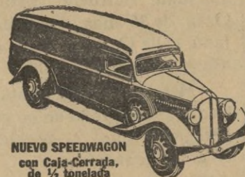
NUEVO SPEEDWAGON con Caja-Cerraja, de 1/2 tonelada