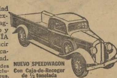
NUEVO SPEEDWAGON con Caja-de-Recoger, de 1/2 tonelada

Estilo perfilado—fuerza para gran velocidad y gran tiro—hechos y equilibrados para extraordinaria duración—estos nuevos y magníficos Speedwagons representan, en todo y por todo, los modelos de MAYOR VALÍA INTRÍNSECA que la Reo ha podido producir durante 30 años de experiencia en la fabricación de vehículos de indiscutible superioridad.