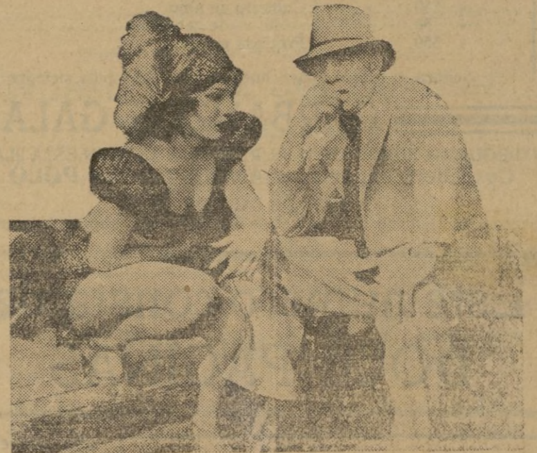
La sugestiva estrella de habla hispana Lupe Vélez, con su director Gregory La Cava, en una toma durante la filmación