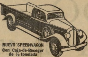
NUEVO SPEEDWAGON con Caja-de-Recoger de 1/2 tonelada

Estilo perfilado—fuerza para gran velocidad y gran tiro—hechos y equilibrados para extraordinaria duración—estos nuevos y magníficos Speedwagons representan, en todo y por todo, los modelos de MAYOR VALIA INTRINSECA que la Reo ha podido producir durante 30 años de experiencia en la fabricación de vehículos de indiscutible superioridad.