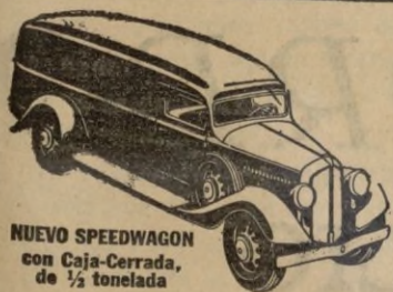
NUEVO SPEEDWAGON con Caja-Cerrada, de 1/2 tonelada