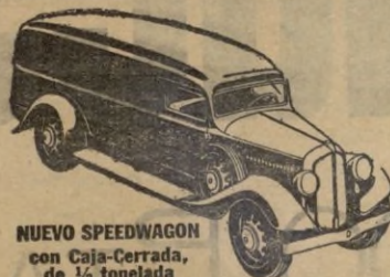
NUEVO SPEEDWAGON con Caja-Cerrada, de 1/2 tonelada