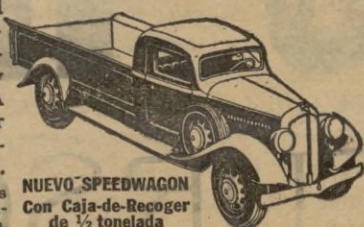
NUEVO SPEEDWAGON con Caja-de-Recoger, de 1/2 tonelada

Estilo perfilado—fuerza para gran velocidad y gran tiro—hechos y equilibrados para extraordinaria duración—estos nuevos y magníficos Speedwagons representan, en todo y por todo, los modelos de MAYOR VALÍA INTRINSECA que la Reo ha podido producir durante 30 años de experiencia en la fabricación de vehículos de indiscutible superioridad. Los Speedwagons Reo se suministran en capacidades de media tonelada y hasta de 4 a 6 toneladas, incluyendo los tipos de Tractor-Remolque y de Omnibus.