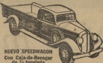
NUEVO SPEEDWAGON Con Caja-de-Recoger de 1/2 tonelada

Estilo perfilado—fuerza para gran velocidad y gran tiro—hechos y equilibrados para extraordinaria duración—estos nuevos y magníficos Speedwagons representan, en todo y por todo, los modelos de MAYOR VALIA INTRINSECA que la Reo ha podido producir durante 30 años de experiencia en la fabricación de vehículos de indiscutible superioridad.