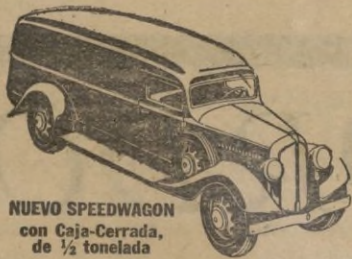
NUEVO SPEEDWAGON con Caja-Cerrada, de 1/2 tonelada