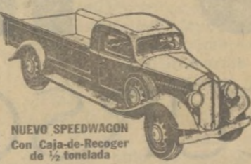
NUEVO SPEEDWAGON con Caja-de-Recoger de 1/2 tonelada

Estilo perfilado—fuerza para gran velocidad y gran tiro—hechos y equilibrados para extraordinaria duración—estos nuevos y magníficos Speedwagons representan, en todo y por todo, los modelos de MAYOR VALÍA INTRÍNSECA que la Reo ha podido producir durante 30 años de experiencia en la fabricación de vehículos de indiscutible superioridad. Los Speedwagons Reo se suministran en capacidades de media tonelada y hasta de 4 a 6 toneladas, incluyendo los tipos de Tractor-Remolque y de Ómnibus.