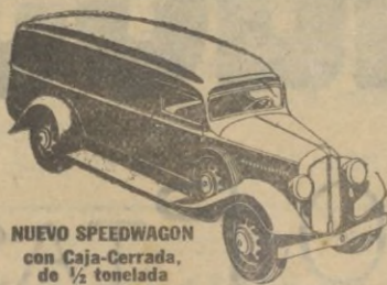
NUEVO SPEEDWAGON con Caja-Cerrada, de 1/2 tonelada