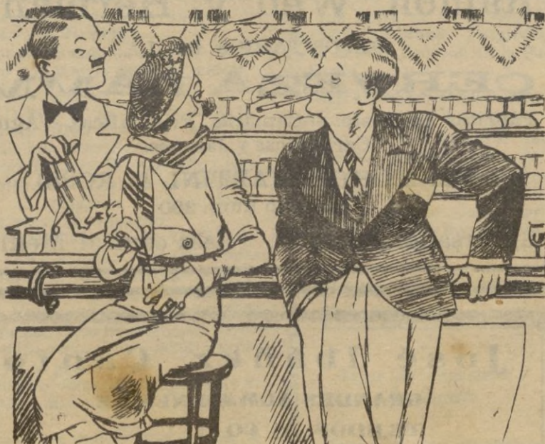
—¿No habíamos quedado en que dejaba usted de fumar? —Sí, pero cuando recorro al cigarrillo, créame, es porque me encuentro demasiado aburrido...