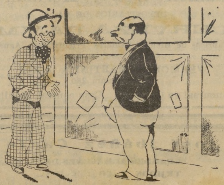
A precio que usted me ofrece, no puedo dejarle los telones. Mis pinturas se venden como pan. —¡Si fuera como buñuelos.