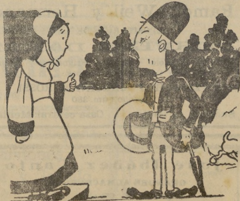
—Anuncio a usted, señorito, que como el carácter de la señora es insoportable, dejo la casa.

—¡Ay, hija mía! ¡Quién pudiera hacer otro tanto como tú!