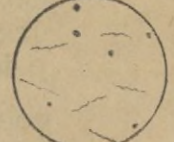
Microbio de la sífilis Treponema pálido de Schaudinn o Epiroqueta de la sífilis

Es una obra de máximo interés y actualidad, ilustrada con grabados referentes a la dolencia. Puede estimarse su importancia leyendo el índice que se reproduce a continuación.