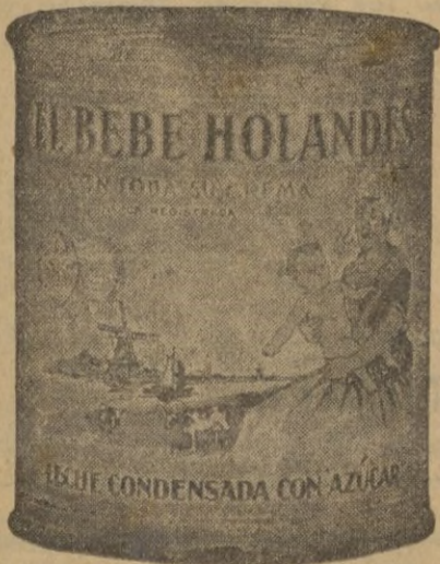
Leche condensada y harina lacteada marca de calidad

FORMULA SECRETO preparación eficazísima, inofensiva, maravilloso Champoin que vuelve al color primitivo los cabellos sin tintes ni mixturas peligrosas al todo el que solicite de Apartado, 10.040. MADRID