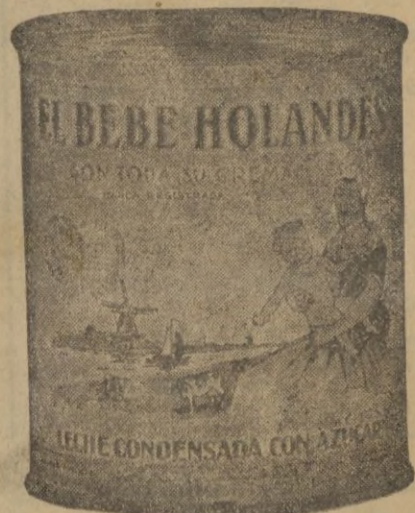
Leche condensada y harina lacteada marca de calidad