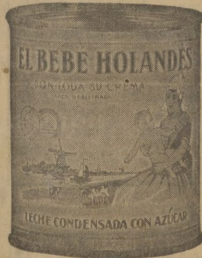
Leche condensada y harina lacteada marca de calidad