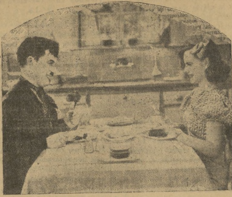
Frente a frente en amoroso coloquio, Charlot y Paulette Godard, 'su linda mujercita, impresionan muy a lo vivo escenas de su nuevo film.