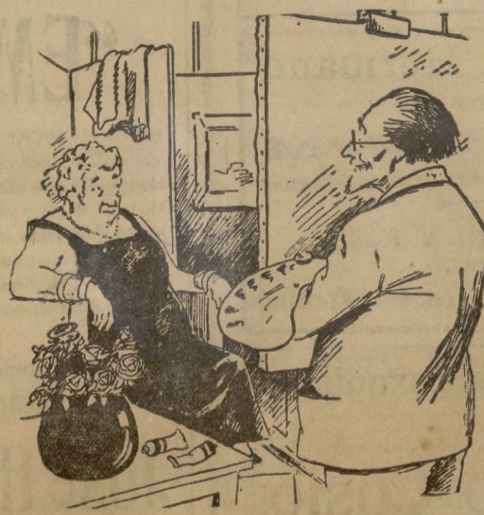
—Mi querido pintor, ¿por cuanto tiempo vas a garantizarme el parecido de la copia con el original... (Gringoire)