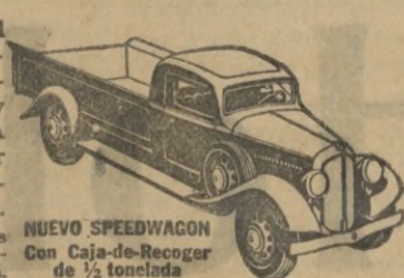
NUEVO SPEEDWAGON con Caja-de-Recoger, de 1/2 tonelada.

Estilo perfilado—fuerza para gran velocidad y gran tiro—hechos y equilibrados para extraordinaria duración—estos nuevos y magníficos Speedwagons representan, en todo y por todo, los modelos de MAYOR VALIA INTRINSECA que la Reo ha podido producir durante 30 años de experiencia en la fabricación de vehículos de indiscutible superioridad.