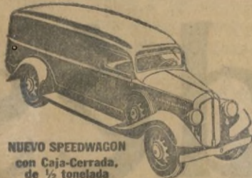
NUEVO SPEEDWAGON con Caja-Cerrada, de 1/2 tonelada.