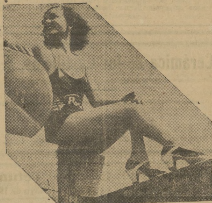
Se acerca el estío y los maillots sintéticos vuelven a ser la preocupación de las bellas bañistas, como esta que ofrece mos a la voracidad de los ojos masculinos.

Y esto lo hacemos extensivo a las escuelas públicas en sus grados superiores. En bien de los propios alumnos así lo deseamos.