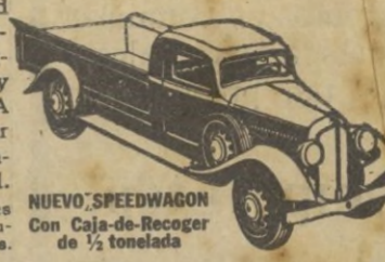
NUEVO SPEEDWAGON con Caja-de-Recoger de 1/2 tonelada

Estilo perfilado—fuerza para gran velocidad y gran tiro—hechos y equilibrados para extraordinaria duración—estos nuevos y magníficos Speedwagons representan, en todo y por todo, los modelos de MAYOR VALÍA INTRINSECA que la Reo ha podido producir durante 30 años de experiencia en la fabricación de vehículos de indiscutible superioridad. Los Speedwagons Reo se suministran en capacidades de media tonelada y hasta de 4 a 6 toneladas, incluyendo los tipos de Tractor-Remolque y de Omníbus.