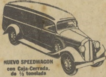
NUEVO SPEEDWAGON con Caja-Cerrada de 1/2 tonelada