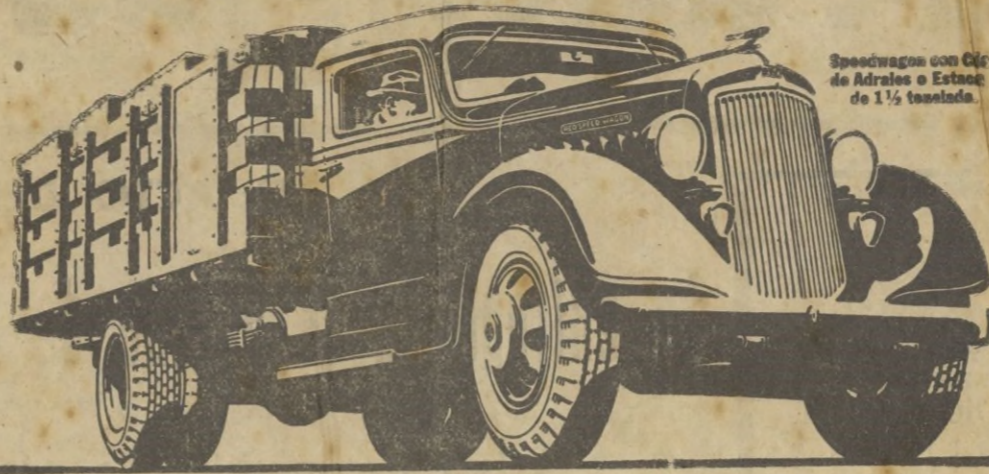
Speedwagon con Caja de Adreles o Estaca de 1 1/2 toneladas.