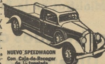
NUEVO SPEEDWAGON con Caja-de-Recoger de 1/2 tonelada

Estilo perfilado—fuerza para gran velocidad y gran tiro—hechos y equilibrados para extraordinaria duración—estos nuevos y magníficos Speedwagons representan, en todo y por todo, los modelos de MAYOR VALÍA INTRÍNSECA que la Reo ha podido producir durante 30 años de experiencia en la fabricación de vehículos de indiscutible superioridad.