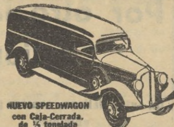
NUEVO SPEEDWAGON con Caja-Cerrada de 1/2 tonelada