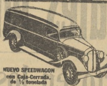
NUEVO SPEEDWAGON con Caja-Cerrada de 1/2 tonelada