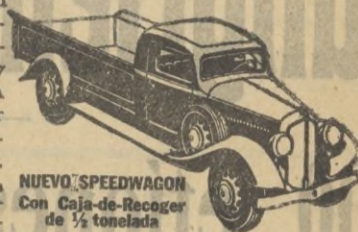
NUEVO SPEEDWAGON con Caja-de-Recoger de 1/2 tonelada

Estilo perfilado—fuerza para gran velocidad y gran tiro—hechos y equilibrados para extraordinaria duración—estos nuevos y magníficos Speedwagons representan, en todo y por todo, los modelos de MAYOR VALIA INTRINSECA que la Reo ha podido producir durante 30 años de experiencia en la fabricación de vehículos de indiscutible superioridad.