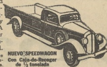
NUEVO SPEEDWAGON con Caja-de-Recoger de 1/2 tonelada

Estilo perfilado—fuerza para gran velocidad y gran tiro—hechos y equilibrados para extraordinaria duración—estos nuevos y magníficos Speedwagons representan, en todo y por todo, los modelos de MAYOR VALÍA INTRÍNSECA que la Reo ha podido producir durante 30 años de experiencia en la fabricación de vehículos de indiscutible superioridad. Los Speedwagons Reo se suministran en capacidades de media tonelada y hasta de 4 a 6 toneladas, incluyendo los tipos de Tractor-Remolque y de Omníbus.