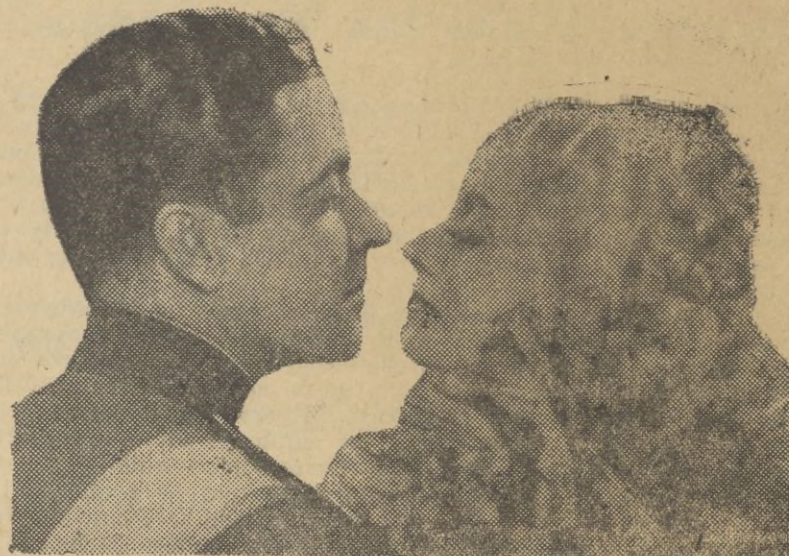
Para Ramón Novarro, una deliciosa compañerita, la rubia Evelyn Laye, se le busca casi de encargo. Ver a ambos en una de sus recientes y admirables actuaciones