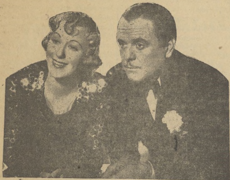
La gracia seductora de Grace Moore, ha encontrado para sus salidas al film, una alianza poderosa. Es Leo Carrillo que se une a ella para ilustrar el celulide del privilegio de su arte