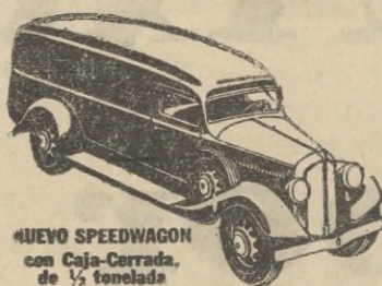
NUEVO SPEEDWAGON con Caja-Cerrada de 1/2 tonelada