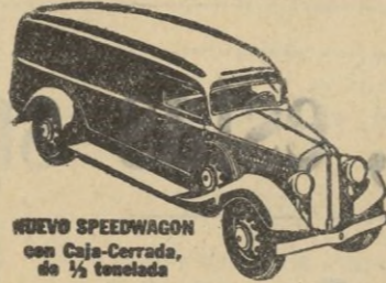
NUEVO SPEEDWAGON con Caja-Cerrada, de 1/2 tonelada