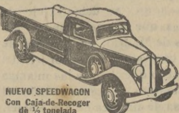
NUEVO SPEEDWAGON con Caja-de-Recoger de 1/2 tonelada

Los Speedwagons Reo se suministran en capacidades de media tonelada y hasta de 6 toneladas, incluyendo los tipos de Tractor-Remolque y de Quilbas.