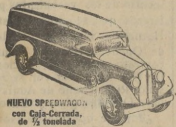
NUEVO SPEEDWAGON con Caja-Cerrada, de 1/2 tonelada

Estilo perfilado—fuerza para gran velocidad y gran tiro—hechos y equilibrados para extraordinaria duración—estos nuevos y magníficos Speedwagons representan, en todo y por todo, los modelos de MAYOR VALIA INTRINSECA que la Reo ha podido producir durante 30 años de experiencia en la fabricación de vehículos de indiscutible superioridad.