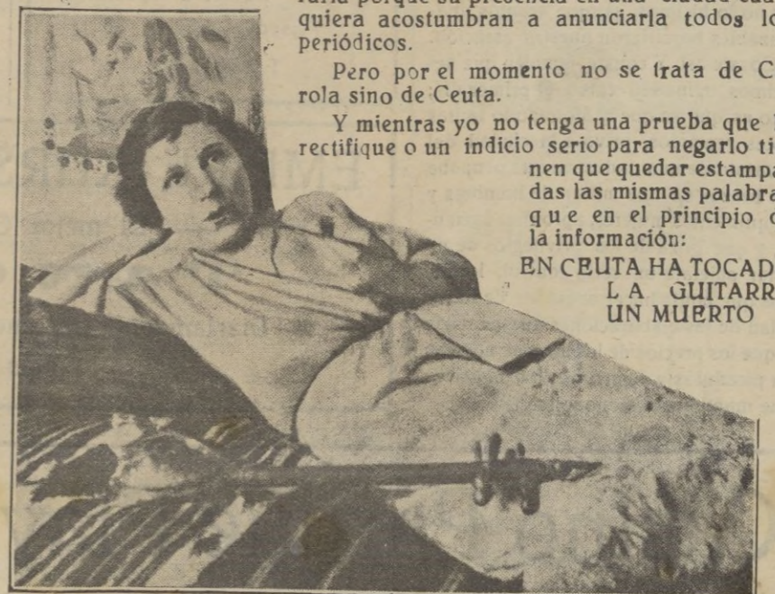
En un rincón sentada en un diván...

EN CEUTA HA TOCADO LA GUITARRA UN MUERTO