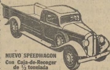
NUEVO SPEEDWAGON con Caja-de-Recoger de 1/2 tonelada

Los Speedwagons Reo se suministran en capacidades de media tonelada y hasta de 4 a 6 toneladas, incluyendo los tipos de Tractor-Remolque y de Omnibus.