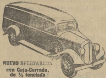
NUEVO SPEEDWAGON con Caja-Cerrada, de 1/2 tonelada

Estilo perfilado—fuerza para gran velocidad y gran tiro—hechos y equilibrados para extraordinaria duración—estos nuevos y magníficos Speedwagons representan, en todo y por todo, los modelos de MAYOR VALIA INTRINSECA que la Reo ha podido producir durante 30 años de experiencia en la fabricación de vehículos de indiscutible superioridad.