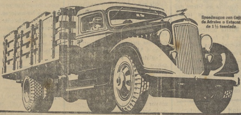
Speedwagon con Caja de Admisión y Estación de 1 1/2 toneladas