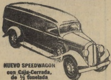
NUEVO SPEEDWAGON con Caja-Cerrada, de 1/2 tonelada

Estilo perfilado—fuerza para gran velocidad y gran tiro—hechos y equilibrados para extraordinaria duración—estos nuevos y magníficos Speedwagons representan, en todo y por todo, los modelos de MAYOR VALIA INTRINSECA que la Reo ha podido producir durante 30 años de experiencia en la fabricación de vehículos de indiscutible superioridad.