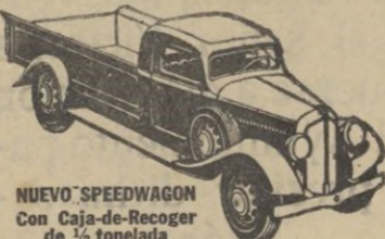
NUEVO SPEEDWAGON Con Caja-de-Recoger de 1/2 tonelada

Estilo perfilado—fuerza para gran velocidad y gran tiro—hechos y equilibrados para extraordinaria duración—estos nuevos y magníficos Speedwagons representan, en todo y por todo, los modelos de MAYOR VALIA INTRINSECA que la Reo ha podido producir durante 30 años de experiencia en la fabricación de vehículos de indiscutible superioridad.