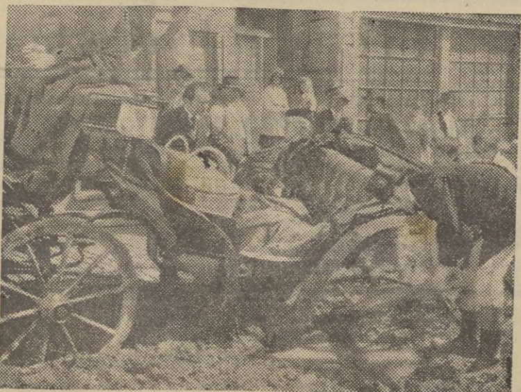
Todo es aprovechable para los americanos. Sobre un fondo de la guerra hispano-yanqui han compuesto una trama que responde al ífido de «Yo amo a una mujer»