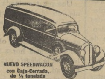
NUEVO SPEEDWAGON con Caja-Cerrada de 1/2 tonelada