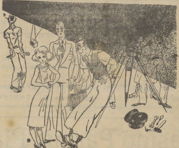
«¿Y usted quiere ser estrella, sin dejarse abrazar? Bueno, consentiré. Pero ha de prometerme que el aparato esté descargado.»