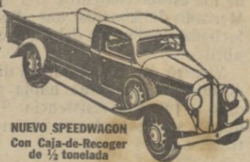
NUEVO SPEEDWAGON con Caja-de-Recoger de 1/2 tonelada

Estilo perfilado—fuerza para gran velocidad y gran tiro—hechos y equilibrados para extraordinaria duración—estos nuevos y magníficos Speedwagons representan, en todo y por todo, los modelos de MAYOR VALIA INTRINSECA que la Reo ha podido producir durante 30 años de experiencia en la fabricación de vehículos de indiscutible superioridad.