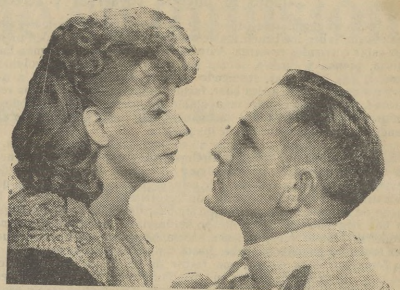
La última producción hecha por Greta Garbo, al dejar tierras americanas fué «Anna Karenina». Una foto de la estrella en ésta versión sonora