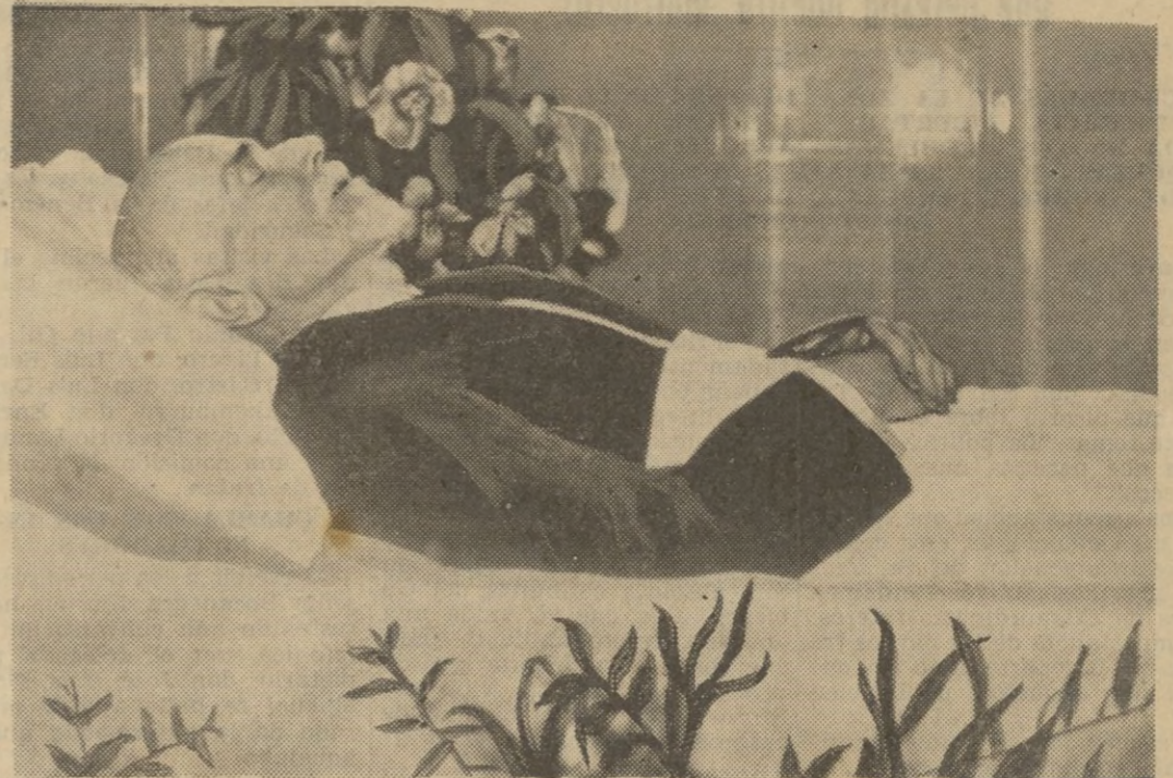
Con la autorización de la familia, esta es la última fotografía del gran político de Grecia, Eleutherio Venizelos, cuyos restos se encuentran ahora en su país.