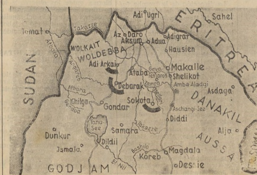
Gráfico de las posiciones de los italianos consolidadas en Dodarak y Sokota. Del primer punto han salido las columnas que han ocupado la importante población de Gondar, que se considera es la que domina el Lago de Tana.