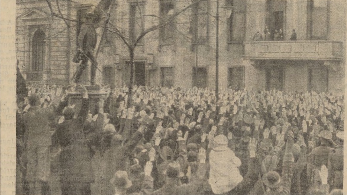
Mientras se comunicaban los resultados electorales, el canceller Hitler tuvo que salir repetidas veces al balcón de palacio de la Cancillería para corresponder a las demostraciones de entusiasmo de la gente.